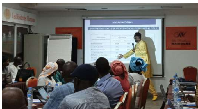
Atelier de restitution des rapports de suivi du DD

Un atelier de restitution des rapports sur le suivi du dividende démographique du Sénégal et de trois régions du Sud, Sédhiou, Kolda et Ziguinchor a réuni les experts et techniciens des ministères sectoriels, des centres de recherche, des partenaires techniques et financiers comme l'UNFPA et le CREG et des représentants de la société civile.