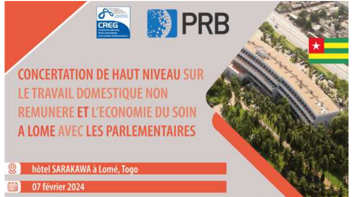
Le 07 Février 2024

- Concertation de haut niveau sur le travail domestique non rémunéré et l'économie du soin avec les parlementaires à Lomé