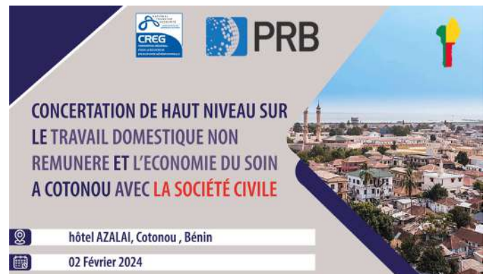
Le 02 Février 2024

Concertation de haut niveau sur le travail non rémunéré et l'économie du soin avec la société civile au Bénin