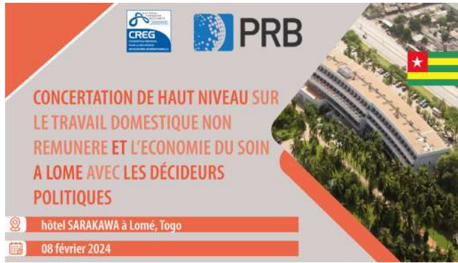
Le 08 Février 2024

- Concertation de haut niveau sur le travail domestique non rémunéré et l'économie du soin avec les décideurs politiques à Lomé