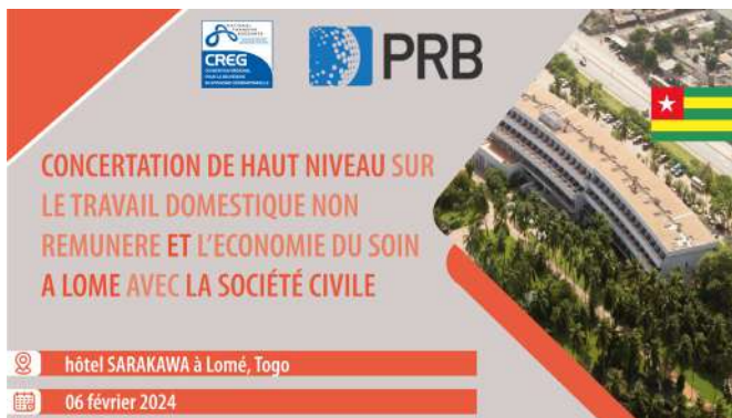
Le 06 Février 2024

- Concertation de haut niveau sur le travail non rémunéré et l'économie du soin avec la société civile à Lomé