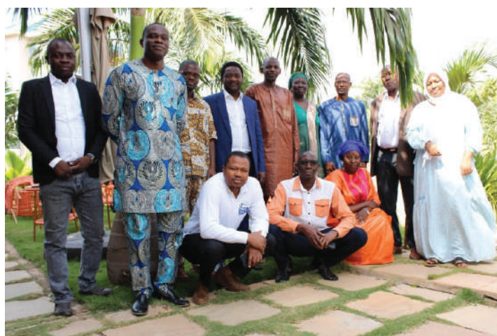
Soutenance du Master en Économie Générationnelle et Politiques Publiques au Bénin

La ville de Parakou au Bénin a accueilli, du 24 au 27 Décembre 2025, un atelier dédié à la soutenance du Master en Économie Générationnelle et Politiques Publiques, ainsi qu'à la rédaction de policy briefs pour le Mali. En ouverture, le Président Coordonnateur du CREG a rappelé l'importance des policy briefs, en mettant en avant leur rôle concret dans l'orientation des politiques publiques et les objectifs poursuivis par cette rencontre. D'abord, les auditeurs ont défendu leurs travaux devant un jury composé des experts du CREG, avant de soutenir officiellement leur Master à l'Université de Parakou.