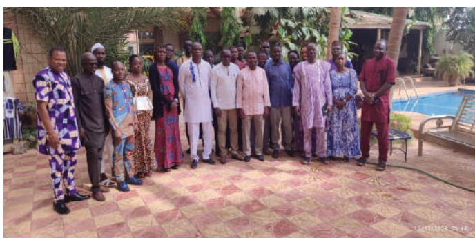
Atelier de calibrage de l'indice de suivi du Dividende Démographique au Burkina Faso

La Direction Générale de l'Économie et de la Planification (DGEP), organe central de planification du Burkina Faso placé sous la tutelle du Ministère de l'Économie, des Finances et de la Prospective, a organisé, en partenariat avec le CREG, l'atelier de calibrage de l'Indice de Suivi du Dividende Démographique. En effet, il avait pour objectif de renforcer les capacités des experts nationaux et régionaux dans le calcul et l'analyse du DDMI, tout en produisant des rapports dimensionnels et un rapport de synthèse.